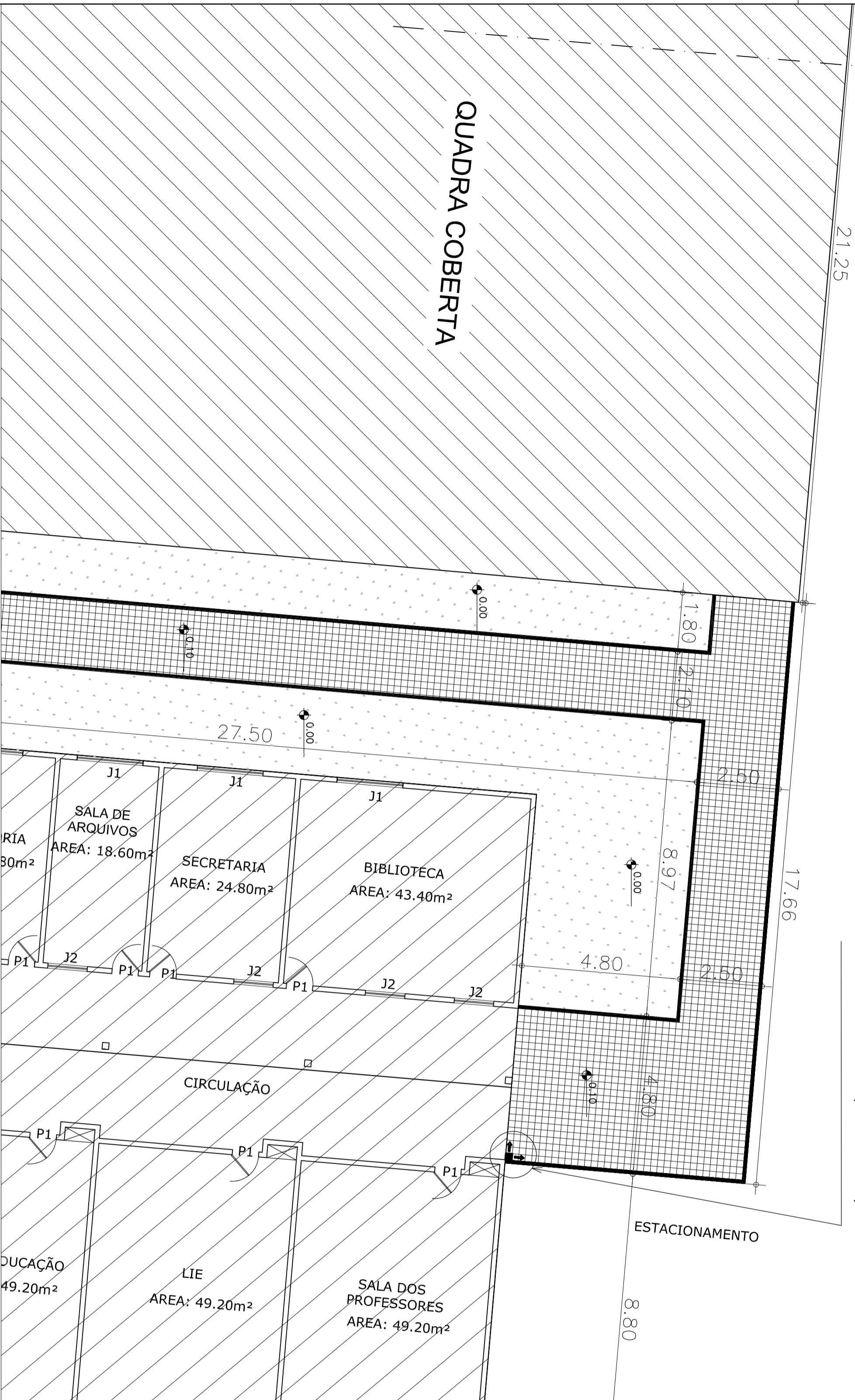
1 PLANTA DE PAGINAÇÃO – PISO ESC.: 1:100

PAGINAÇÃO PISO EM MOSAICO ANTI-DERRAPANTE LISO 20x20cm (VER DETALHE)